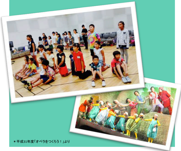
*平成31年度「オペラをつくろう！」より