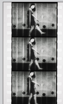
Teinosuke Kinugasa, A Page of Madness, 1926 (restored version), film 35mm, black and white, silent, 67 min., Donated by Society of Japanese Friends of Centre Pompidou, 2019 (Photographs) © right reserved © photo : Centre Pompidou, MNAM-CCI/Hervé Veronique/Dist. RMN-GP