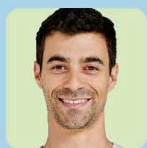
ブルーノ・エスティマ