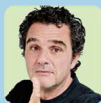
ジョルジュ・ブレンダス