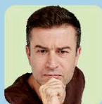
ジョルジュ・ケイジョ