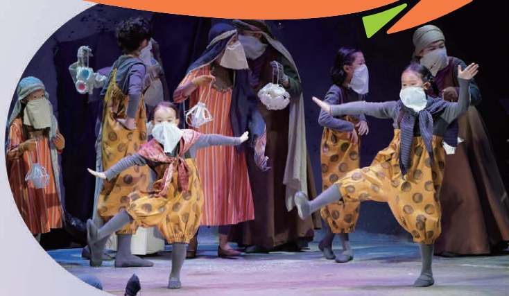
2020年公演写真