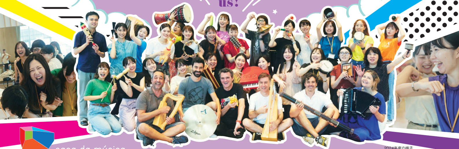
2024年度の様子