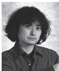
演出 粟國 淳 Production: AGUNI Jun