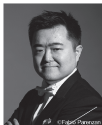
指揮 園田隆一郎 Conductor: SONODA Ryuichiro