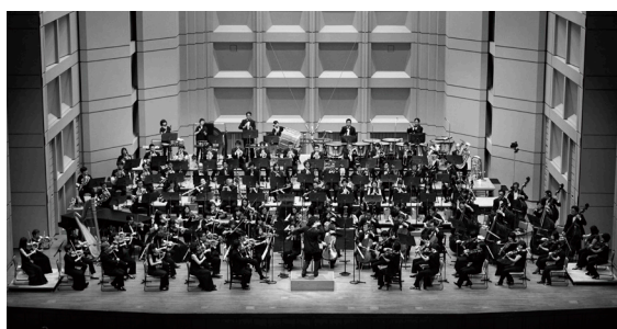
東京フィルハーモニー交響楽団(管弦楽)