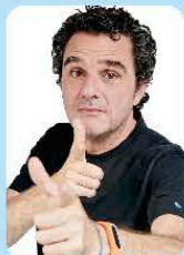
ジョルジュ・プレンドス