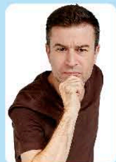
ジョルジュ・ケイジョ