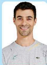
ブルーノ・エステマ