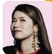
滝千春 ヴァイオリン ※特別ゲスト