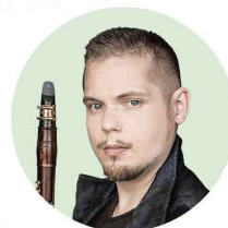
コハーン・ イシュトヴァーン クラリネット