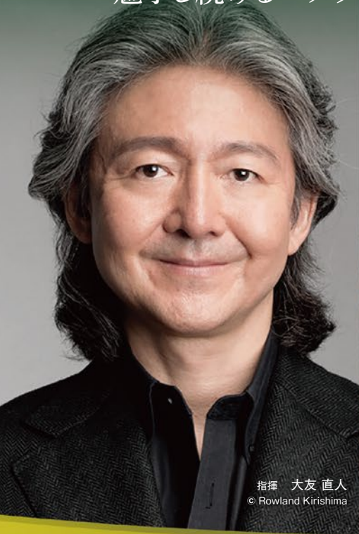
指揮 大友 直人

期待の新星による美しい旋律あふれるヴァイオリンの名曲と、 魅了し続けるベテランの華やかなピアノ協奏曲をぜひお楽しみください。