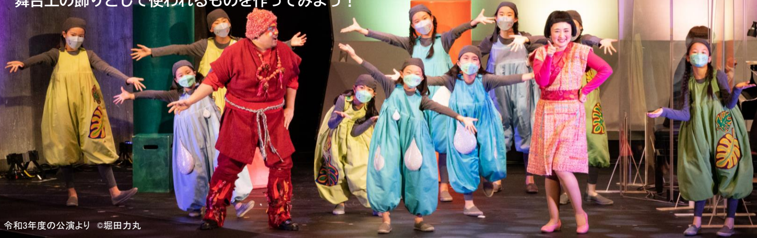
令和3年度の公演より

東京文化会館オペラBOXと連動し、子供たちが本格的なオペラに挑戦！ 《合唱・演技》のワークショップに参加してオペラに出演しよう！ 《工作》のワークショップでオペラにまつわる作品や、 舞台上の飾りとして使われるものを作ってみよう！