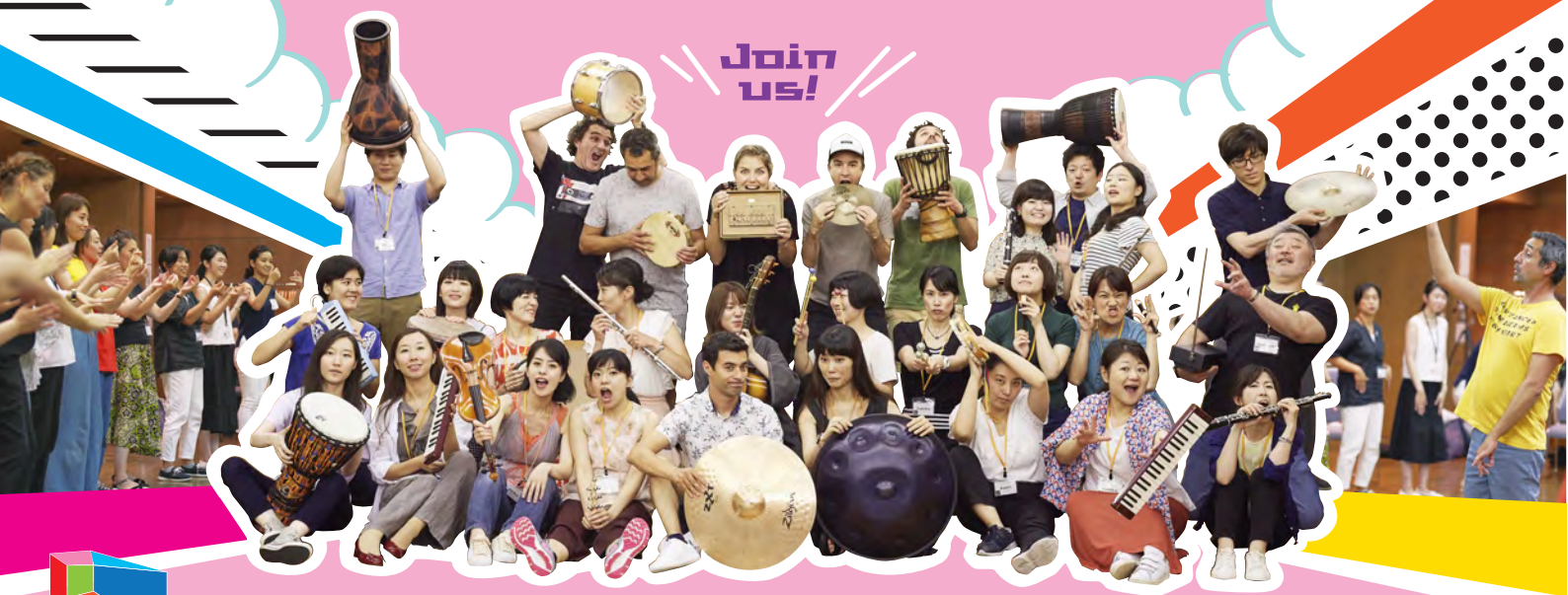
2019年度の様子

最先端の教育普及活動を行っている海外の音楽施設と連携し 音楽の喜びや楽しさを、新たな切り口で幅広い層に伝えるための人材を育成します。 優秀な受講生にはカーザ・ダ・ムジカ(ポルトガル)での派遣研修のチャンスも!