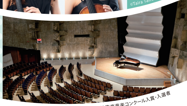
*は東京音楽コンクール入賞・入選者

※東京都のガイドライン等に基づき販売いたします。収容定員制限と販売状況に応じ、今後販売を停止する 場合がございます。予めご了承の上ご購入ください。 ※最前列はC列です。 ※発売日には全席を販売します。 ※やむを得ない事情により、内容が変更になる場合がございますので予めご了承ください。 ※未就学児の入場はご遠慮ください。 ※託児サービス(要予約・有料・定員あり・2月18日(金)17時締切)があります。 イベント託児・マザーズ：0120-788-222