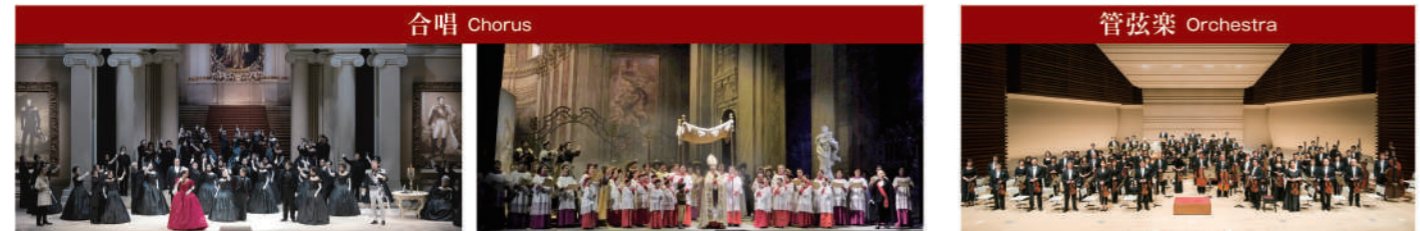
新国立劇場合唱団 New National Theatre Chorus, 二期会合唱団 Nikikai Chorus Group, 東京都交響楽団 Tokyo Metropolitan Symphony Orchestra