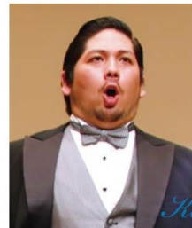
テノール 工藤和真

可憐な舞台姿と聴くものの心を震わせる歌声で高い人気を誇るソプラノ歌手。日伊声楽コンクール優勝、日本音楽コンクール第1位、五島記念文化賞・オペラ新人賞受賞、リッカルド・ザンドナイ国際声楽コンクール ザンドナイ賞など、数々の受賞歴を誇る。武蔵野音楽大学卒業、同大学大学院修了。さらに江副育英会、五島記念文化財団の奨学生としてイタリアで研鑽を積む。2000年新国立劇場「オルフェオとエウリディーチェ」、翌年の藤原歌劇団公演「イル・カンピエッロ」での華々しいデビューに続き、数々のオペラ公演に出演を続けている。とりわけ「ラ・ボエーム」のミミは「歌唱・容姿ともに理想のミミ」と絶賛を博している。近年では新国立劇場「ジャンニ・スキッキ」、<オペラ夏の祭典>でのバルセロナ響との「トゥーランドット」、日生劇場「トスカ」、びわ湖ホール「神々の黄昏」に出演。NHKニューイヤーオペラコンサートには、02年に初登場以来出演を重ねている。藤原歌劇団団員。沖縄県宮古島出身。