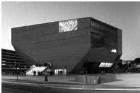
casa da música

「カーザ・ダ・ムジカ」、日本語で「音楽の家」を意味するこの施設は、音楽による創造を目的としたポルトガル初の音楽専門施設として2005年に開館し、多様な芸術・文化が融合したフェスティバルやコンサートを開催しています。“音楽は芸術であると同時に人々の心の豊かさを育むもの”という信念のもと、あらゆる人に豊かな音楽体験をしてもらうことを教育プログラムの使命として掲げ、地域に根ざした活動や市民が積極的に携わるプロジェクトを展開しています。